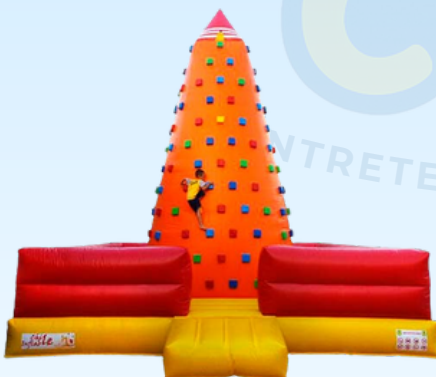
MURO DE ESCALADA

Edad: 3 a 12 años Capacidad máxima 6 niños.